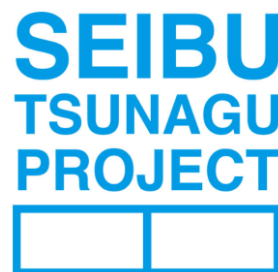
プロジェクトロゴ

今後、想いを持った人同士が“つながり”その想いをかたちにする場を作り、また地域の一員として“つながり”まちを魅力的にするサービスを生み出してまいります。