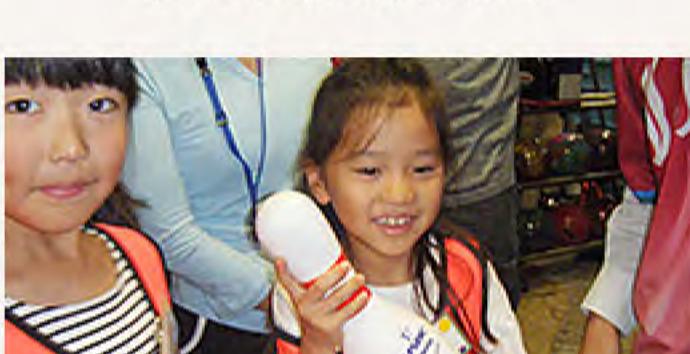
ピンの大きさと重さにビックリ！