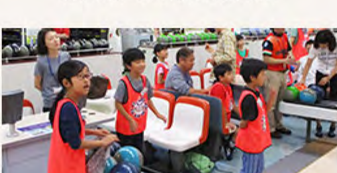
本番のスコアがなります！