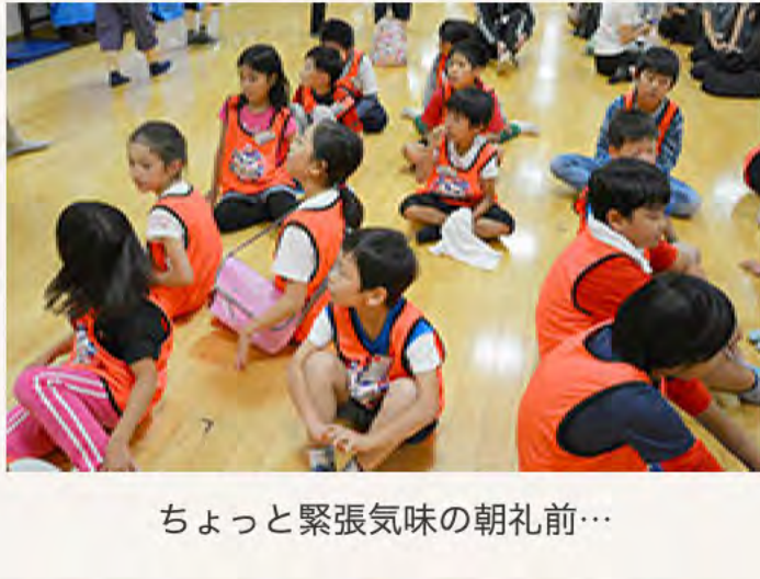
ちょっと緊張気味の朝礼前…