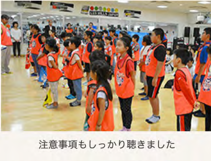
注意事項もしっかり聴きました