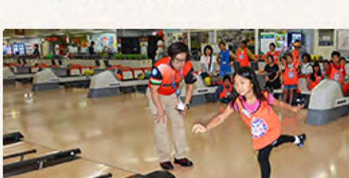
ポーズは決まったけど…