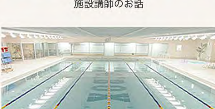
プールもあるんだ…