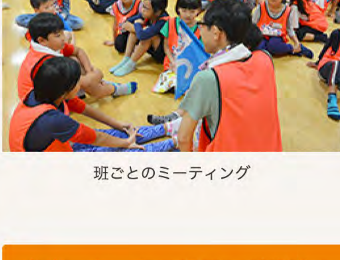
班ごとのミーティング