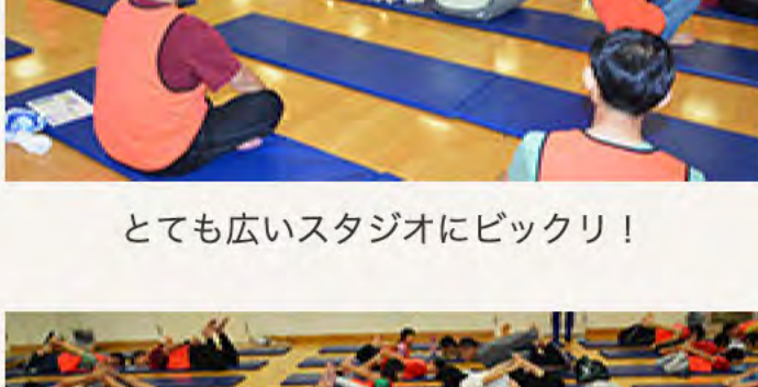
とても広いスタジオにビックリ！