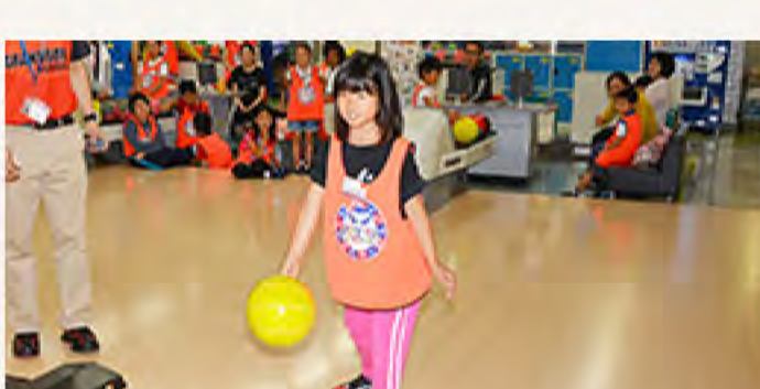
基本をしっかり教わりました

プロボウラーからボウリングのマナーや投げ方を教わり、親子ペアで実技にも挑戦！不安そうだった表情も、慣れてくるとピンを倒した自慢の表情が変わり、爽やかな汗を流して取り組んでいました。