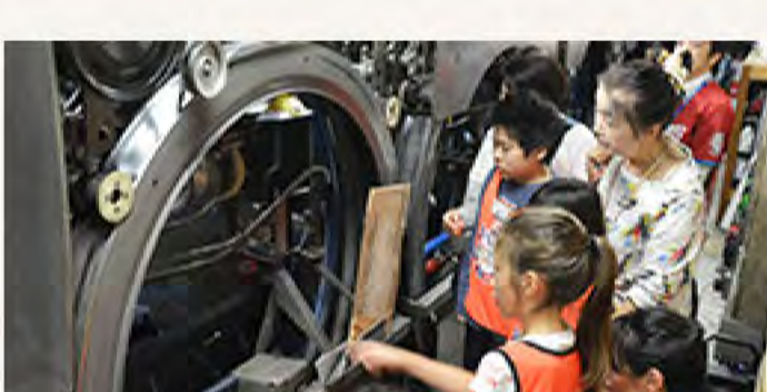
ピンとボールの動きを追いまします