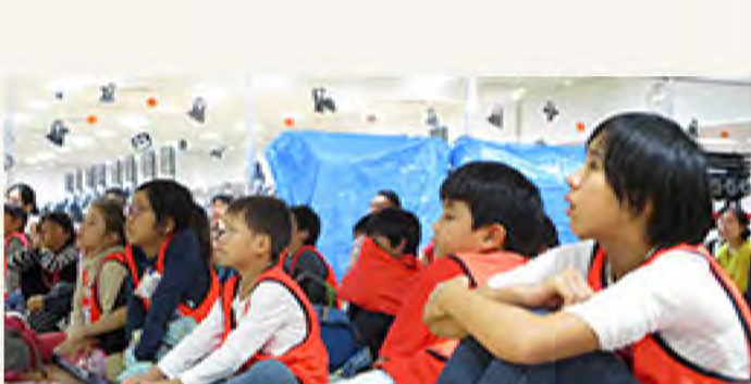
真剣に聞き入っている塾生たち