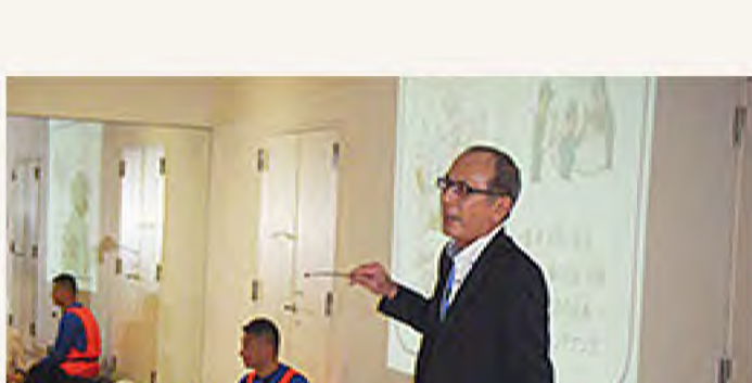
24時間体制で見守っています！