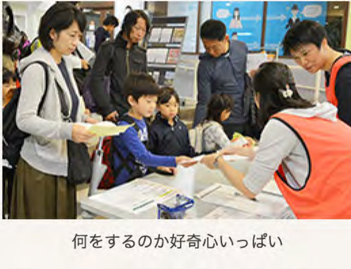
何をするか好奇心いっぱい