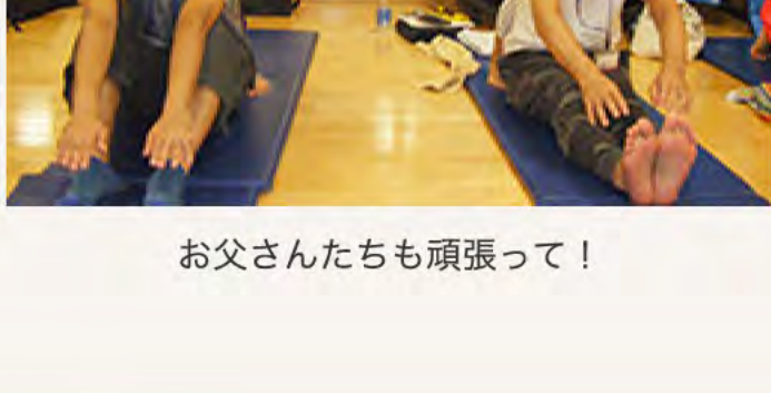
お父さんたちも頑張ってる！