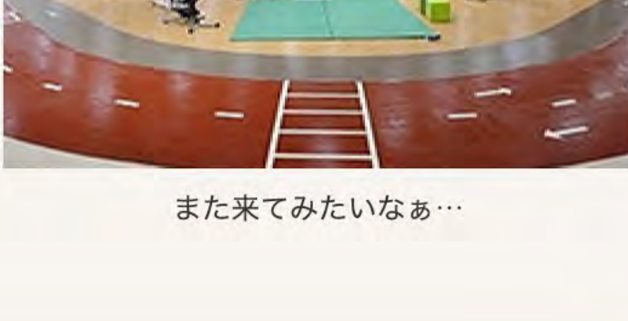
また来てみたいなあ…