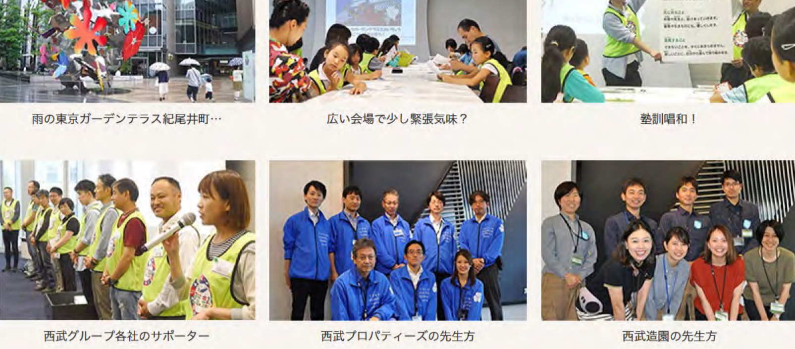
雨の東京ガーデンテラス紀尾井町...

朝礼では、西武プロパティーズと西武造園の先生方への紹介と施設概要のお話がありました。そして、大きな声で「整訓」を唱和して講座がスタートしました。