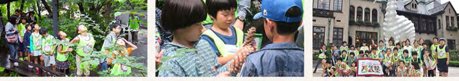
都会の自然、とても落ちつき...