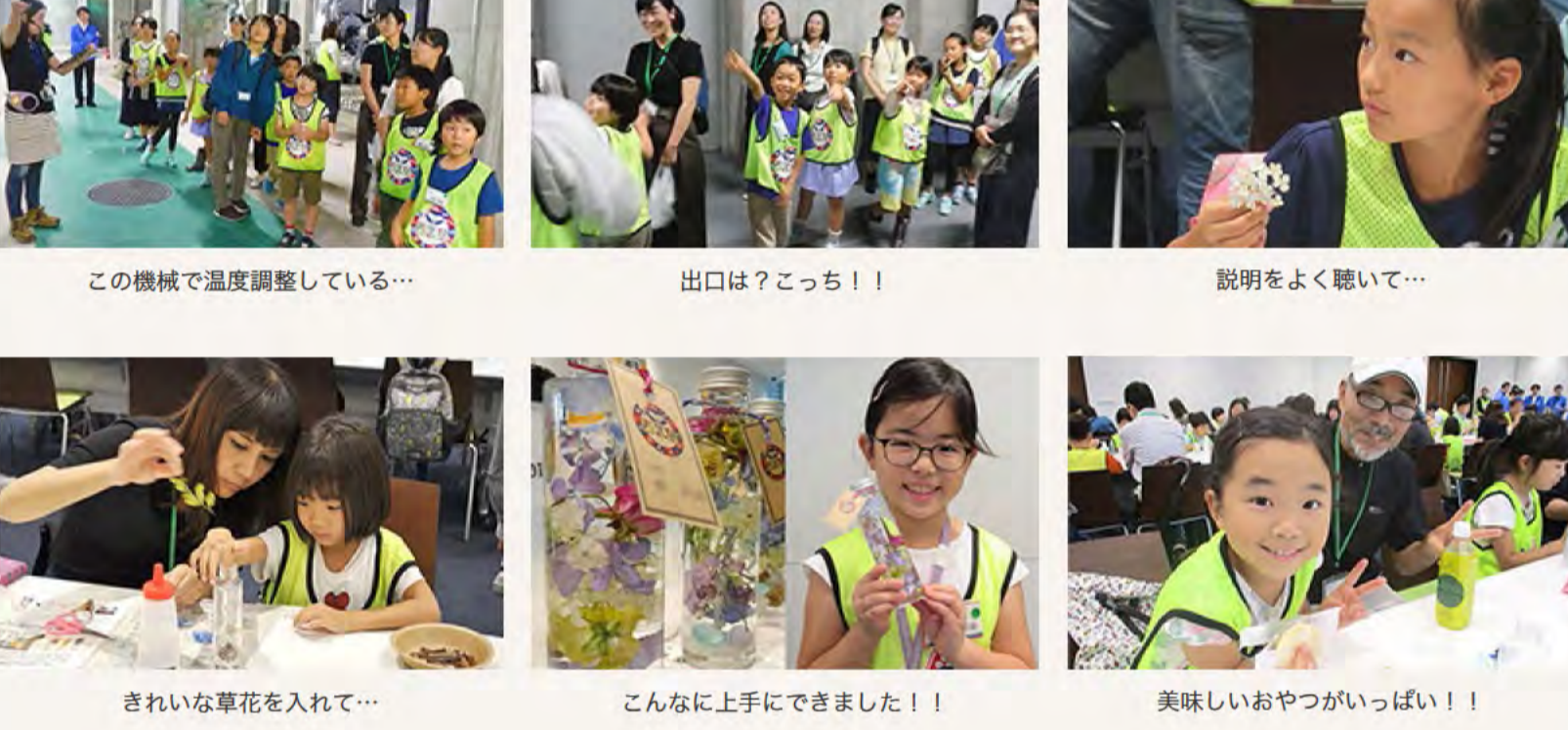
この機械で温度調整している...

その後は、塾生たちが楽しみにしていた「おやつタイム」です。プリンスホテル特製のパームクレーンやクッキーを保護者やサポーターと一緒に食べながら楽しいひと時を過ごしました。