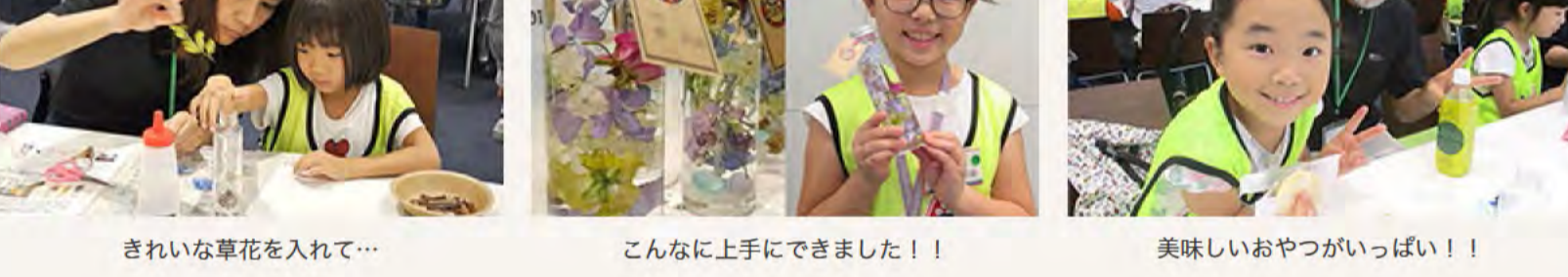
きれいな草花を入れて...