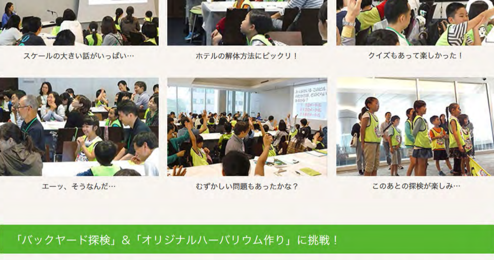
スケールの大きい話がいっぱい...