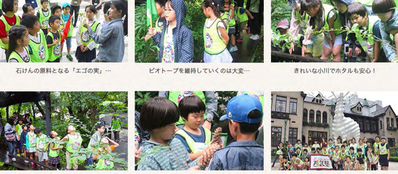
石けんの原料となる「エゴの実」...